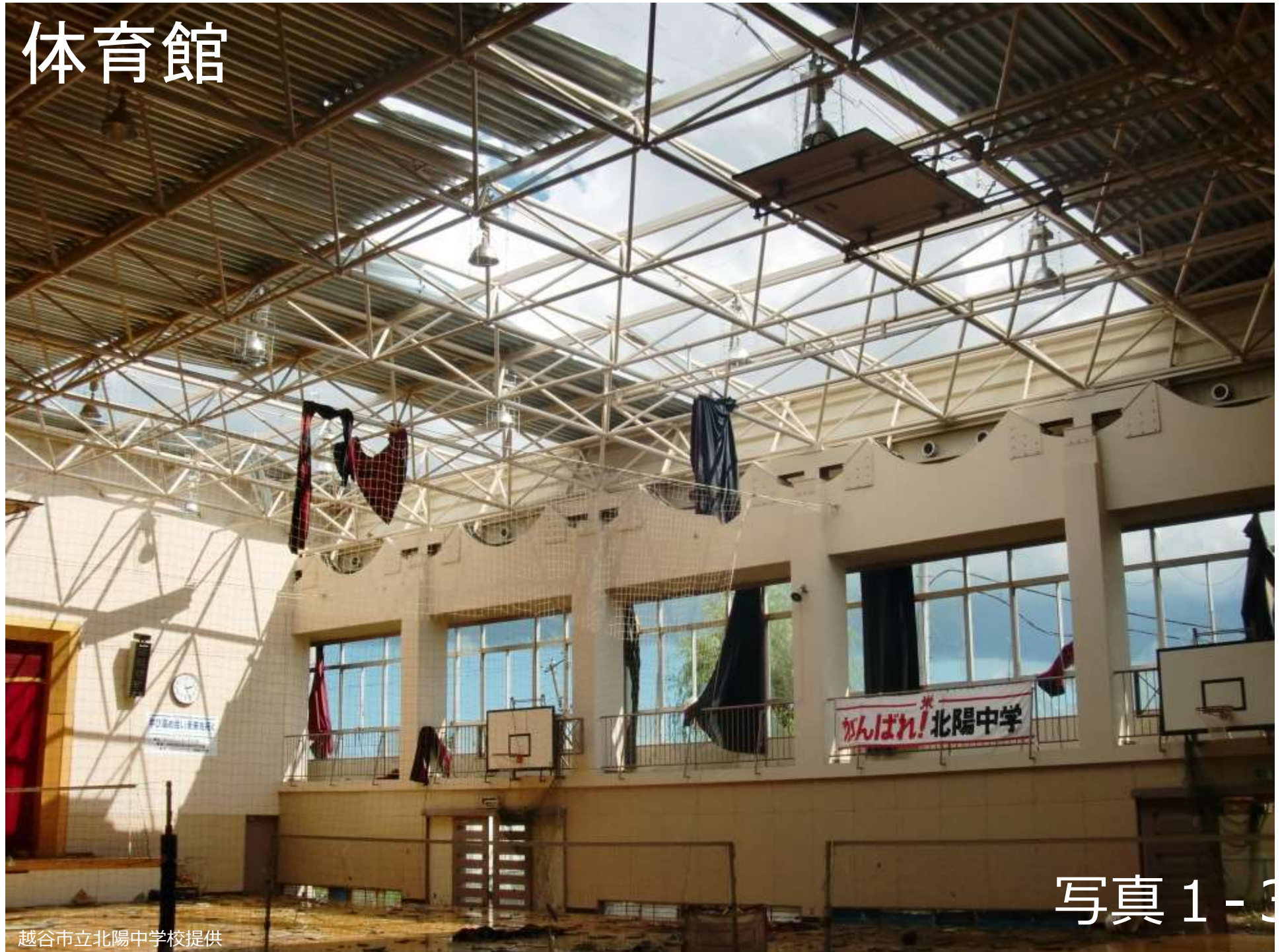
写真 1 - 3