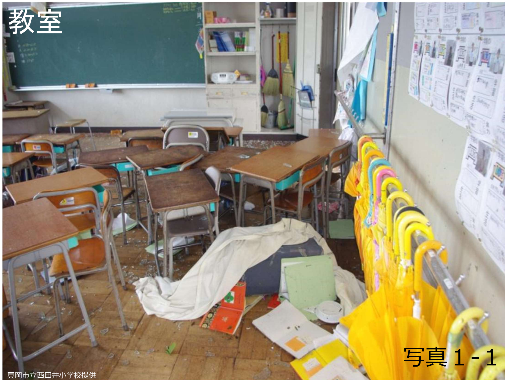
写真 1 - 1